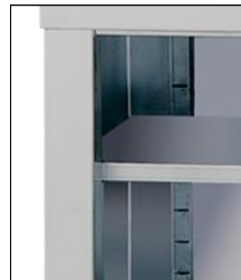
Part. ripiano intermedio e cremagliera