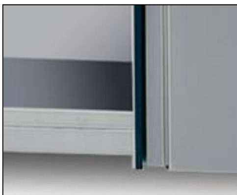
Part. anta scorrevole