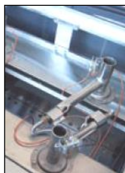
Part. bruciatore a gas