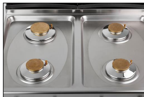
Part. involucro stampato ed a tenuta stagna