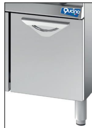
Part. anta inox opzionale