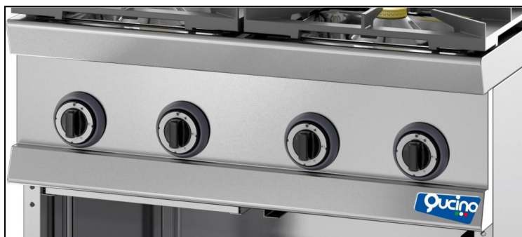
Part. cruscotto comandi