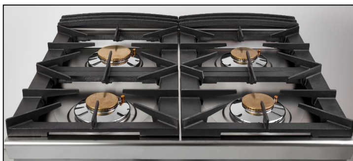
Part. piano cottura

• Piano di cottura, cruscotto e parti esterne a vista in acciaio inox AISI 304, mentre il resto è in AISI serie 400, comprese le parti interne quali camere di combustione e camini interni (altri fabbricanti normalmente per le parti interne utilizzano lamiera zincata) • Condotti gas dei bruciatori primari in tubo inox flessibile • Macchina dotata di fiamma pilota • Piano di lavoro con involucro stampato ed a tenuta stagna, per una facile pulizia e maggiore sicurezza • Ampie griglie poggia-pentole in ghisa, senza utilizzo di distanziale centrale • Cruscotto comandi incassato per una migliore protezione • Ante inox opzionali complete di cerniere e calamita.