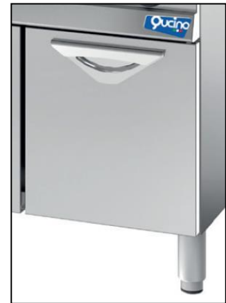
Part. anta inox opzionale