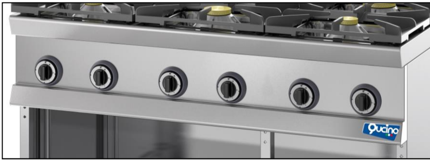
Part. cruscotto comandi