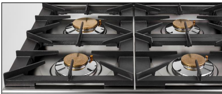
Part. piano cottura