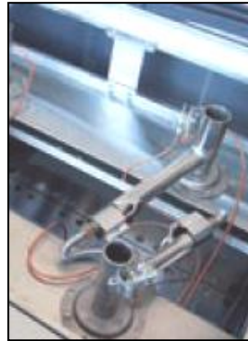
Part. bruciatore a gas