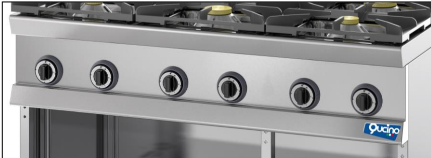
Part. cruscotto comandi