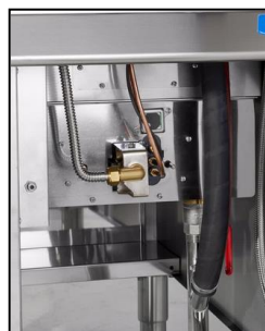
Part. vano tecnico interno