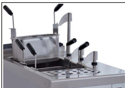
Sollevatori cestelli automatici opzionali