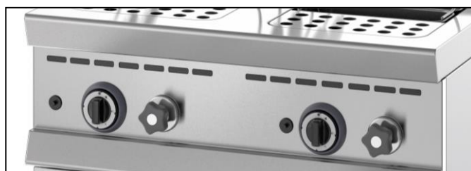
Part. cruscotto con comandi