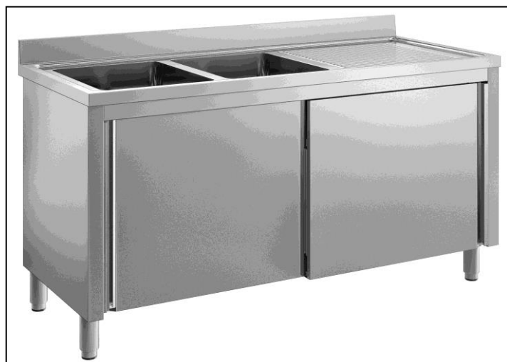
Part. guida e ancoraggio ante scorrevole