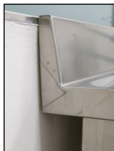
Part. alzatina con tamponatura laterale