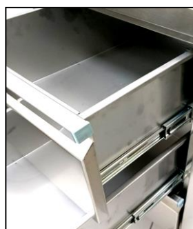
Part. guide cassetto opzionale