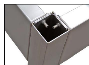
Part. staffe di ancoraggio