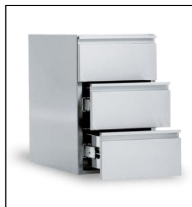
Cassettiera opzionale a 2 o 3 cassetti