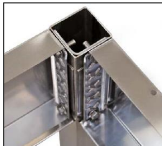
Part. staffe di ancoraggio