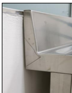
Part. alzatina con tamponatura laterale