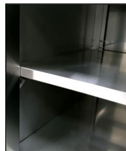
Part. ripiano intermedio e cremagliera

Tavolo armadiato mm. 1200x700x850/900h con ante scorrevoli, alzatina e ripiano intermedio