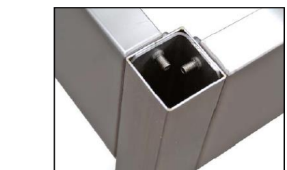
Part. staffe di ancoraggio