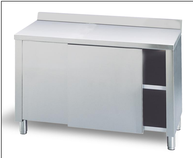
Part. guida e ancoraggio anta scorrevole