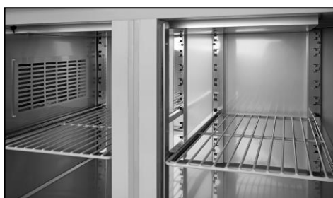
Part. allestimento interno montato ad incastro con guide griglia/teglie