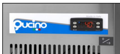
Part. comandi digitali