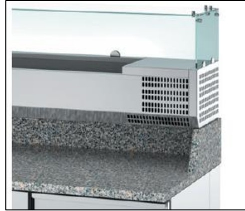
Alzatina di cm. 20 per garantire maggiore spazio e manovrabilità' sotto il portabacinelle refrigerato