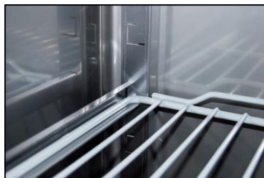
Allestimento interno montato ad incastro con guide griglie/teglie