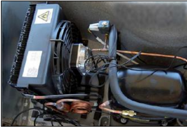
Unità refrigerante a risparmio energetico