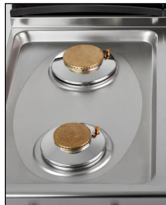
Part. involucro stampato ed a tenuta stagna