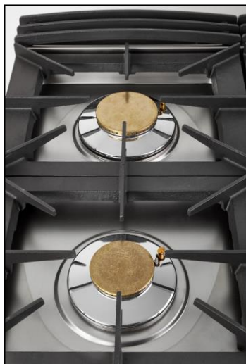
Part. piano cottura

• Piano di cottura, cruscotto e parti esterne a vista in acciaio inox AISI 304, mentre il resto è in AISI serie 400, comprese le parti interne quali camere di combustione e camini interni (altri fabbricanti normalmente per le parti interne utilizzano lamiera zincata) • Condotti gas dei bruciatori primari in tubo inox flessibile • Macchina dotata di fiamma pilota • Piano di lavoro con involucro stampato ed a tenuta stagna, per una facile pulizia e maggiore sicurezza • Ampie griglie poggia-pentole in ghisa, senza utilizzo di distanziale centrale • Cruscotto comandi incassato per una migliore protezione • Anta inox opzionale completa di cerniere e calamita.