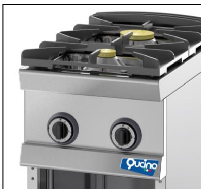
Part. cruscotto comandi