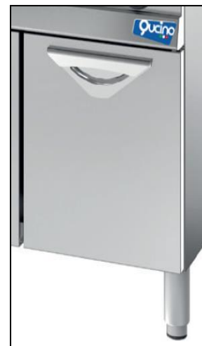
Part. optional porta ad anta inox