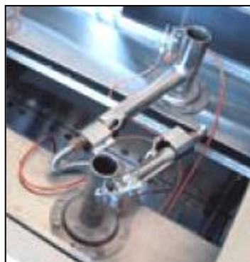
Part. bruciatore a gas