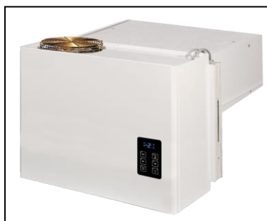
MONOBLOCCO CONDENSAZIONE AD ARIA