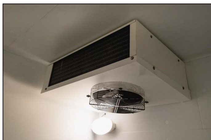
Part. illuminazione interna e gruppo condensatore/ventola