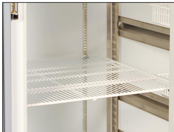
Part. griglie estraibili