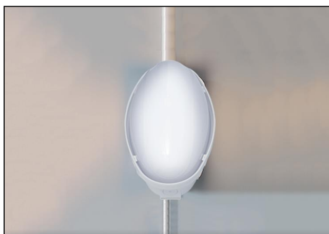
Part. illuminazione interna