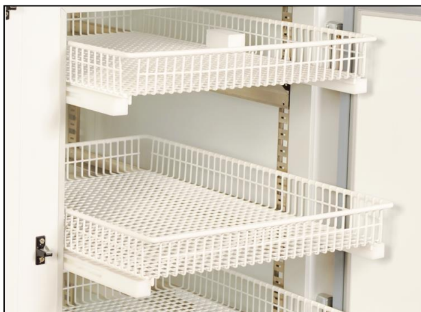
Part. cestelli estraibili