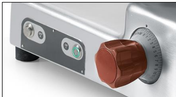
Part. comando start/stop aderente al corpo macchina e regolatore graduato di spessore lama