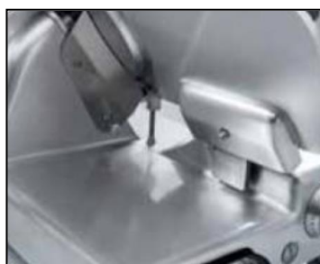
Spazioso piano per appoggio prodotto