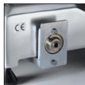
Meccanismo sgancio piatto