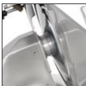
Ampio spazio tra lama e corpo macchina