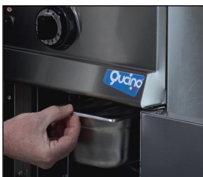
Part. vaschetta raccogligrassi estraibile