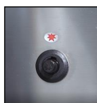
Part. accensione piezoelettrico