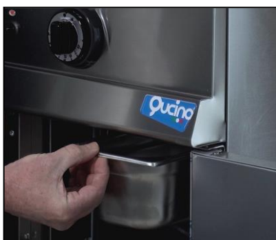
Part. vaschetta raccogligrassi estraibile