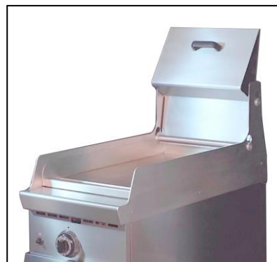
Kit coperchio speciale (opzionale)