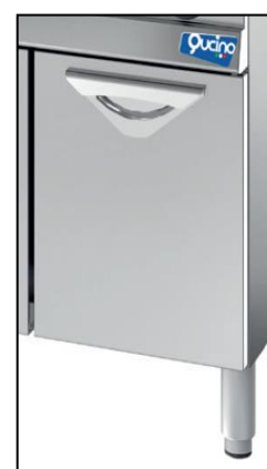
Part. anta inox (opzionale)