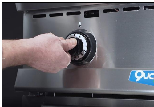
Part. termostato a 8 posizioni